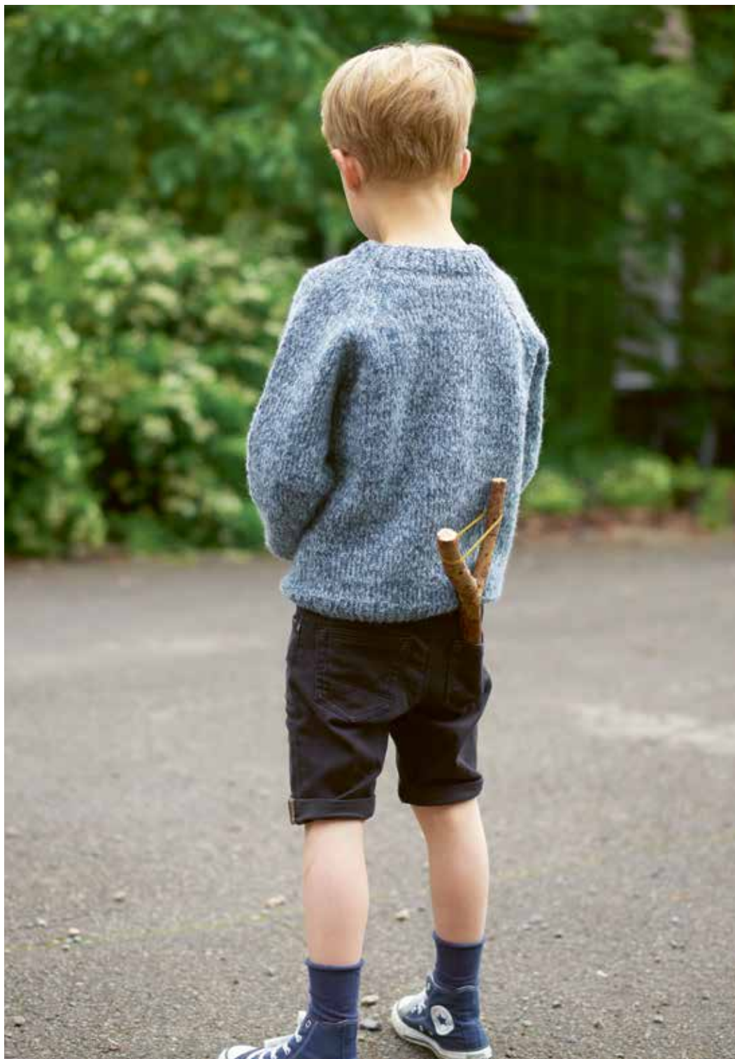
311-3 A Go'enser i Finull og Alpaca Silk 2 - 12 år

Se forhandlerliste på www.raumagarn.no Del arbeidet ditt på Instagram #raumagarn