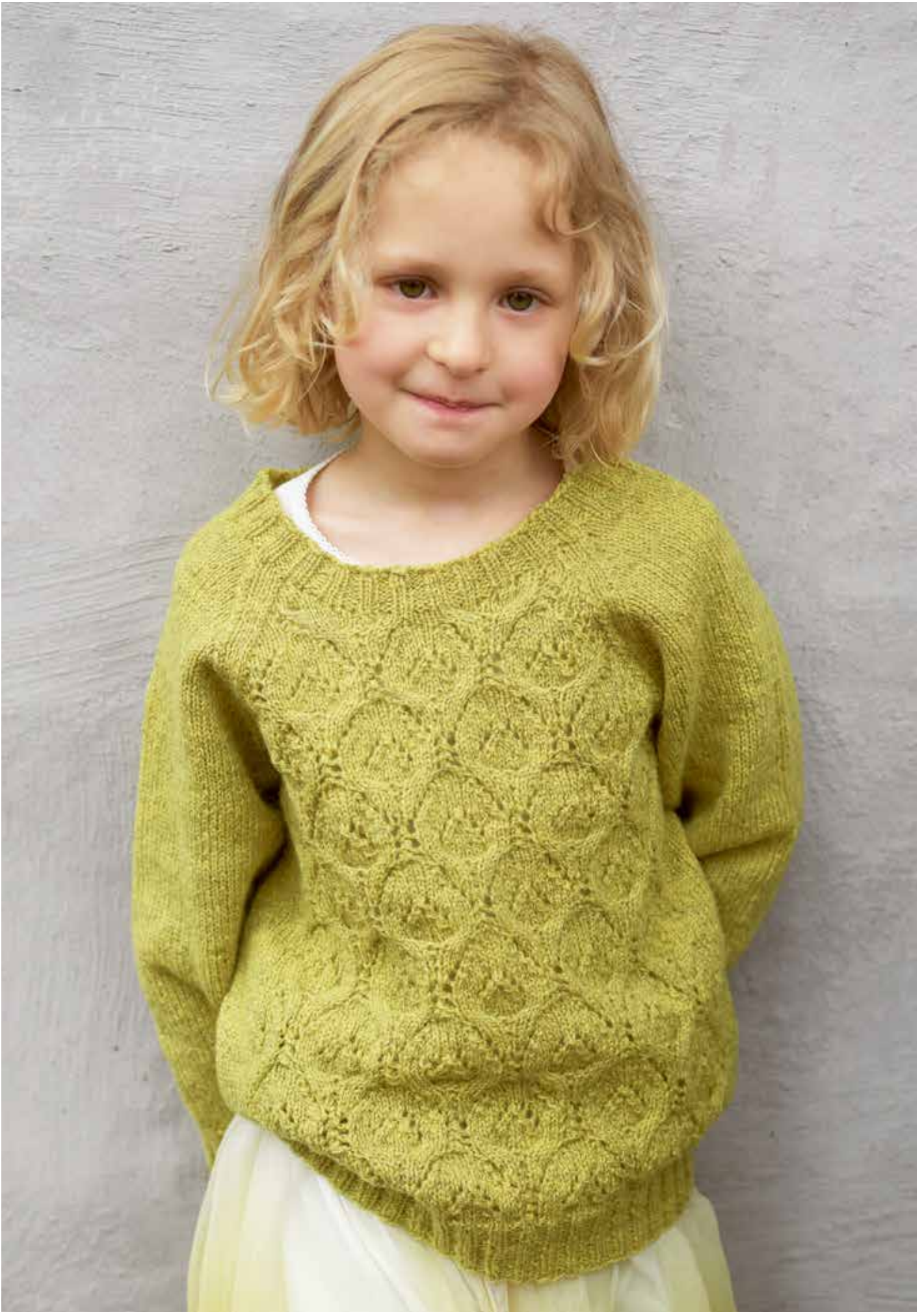
311-9 Fiolagenser Finull 2 - 12 år