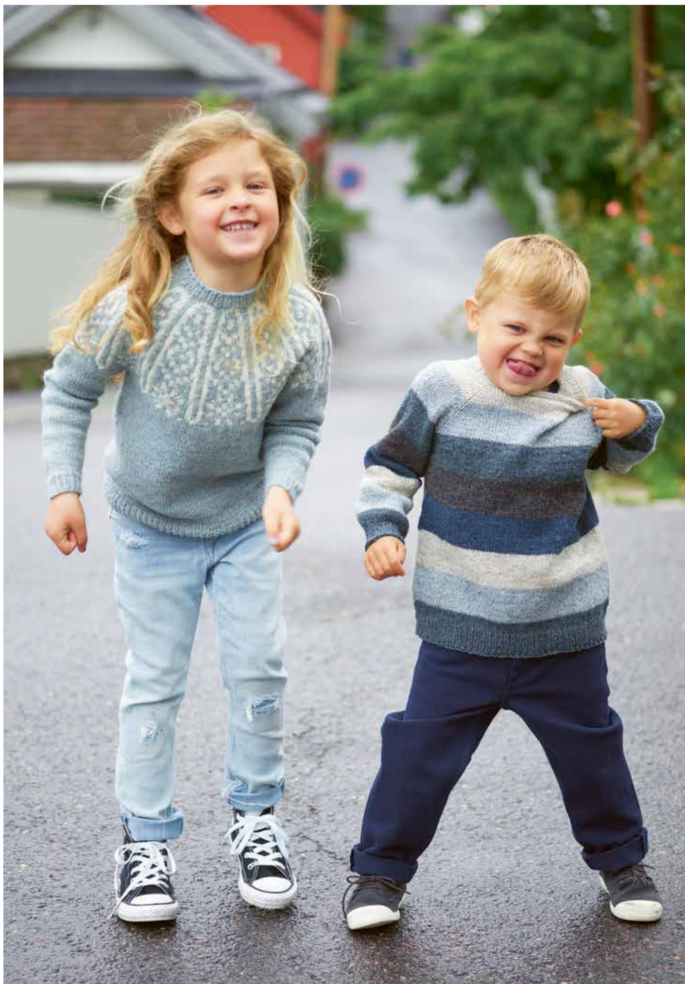
311-1 Venninngenser i Finull 2 - 12 år