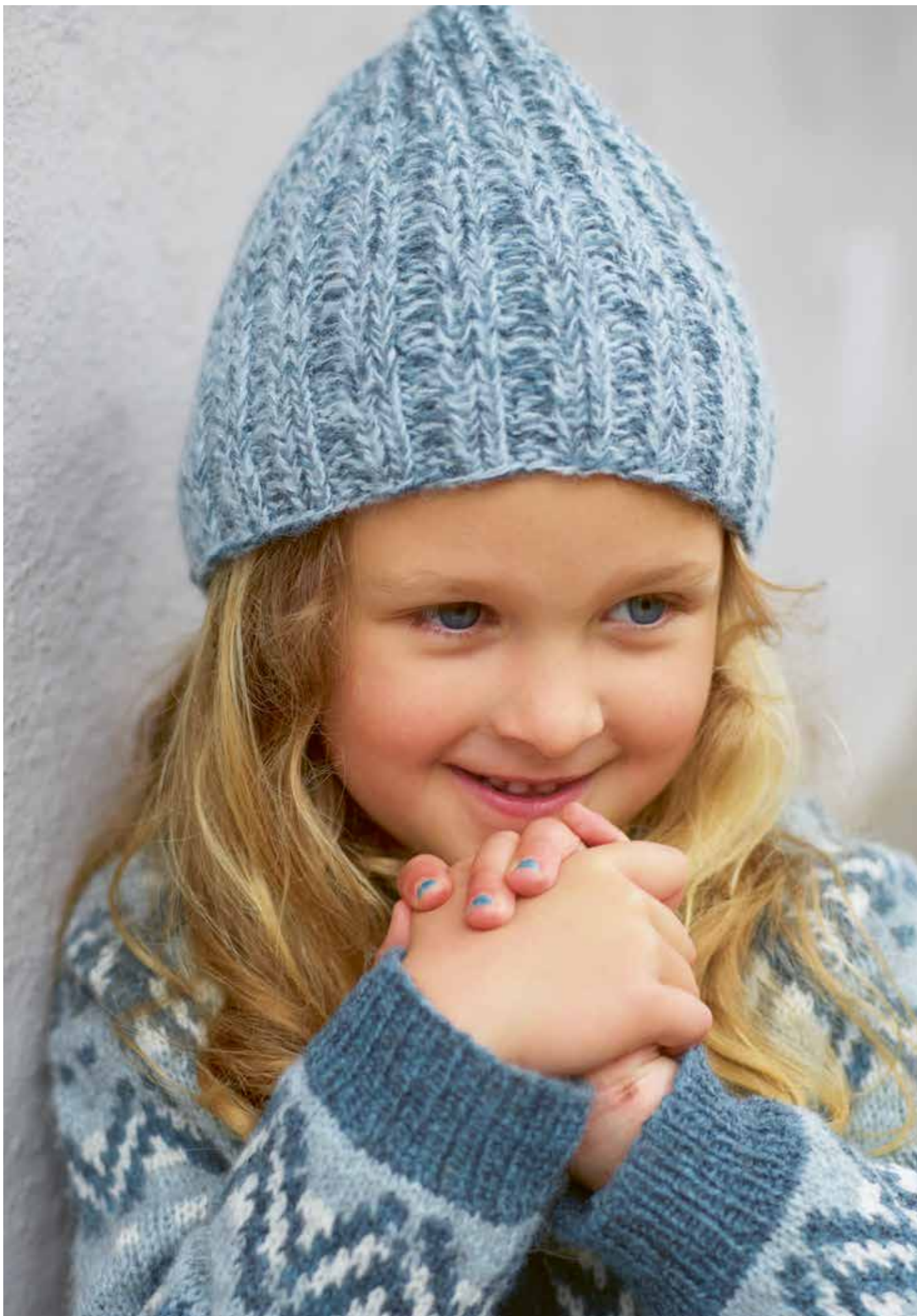
311-5 Go'lue i Finull og Alpaca Silk 2 - 12 år