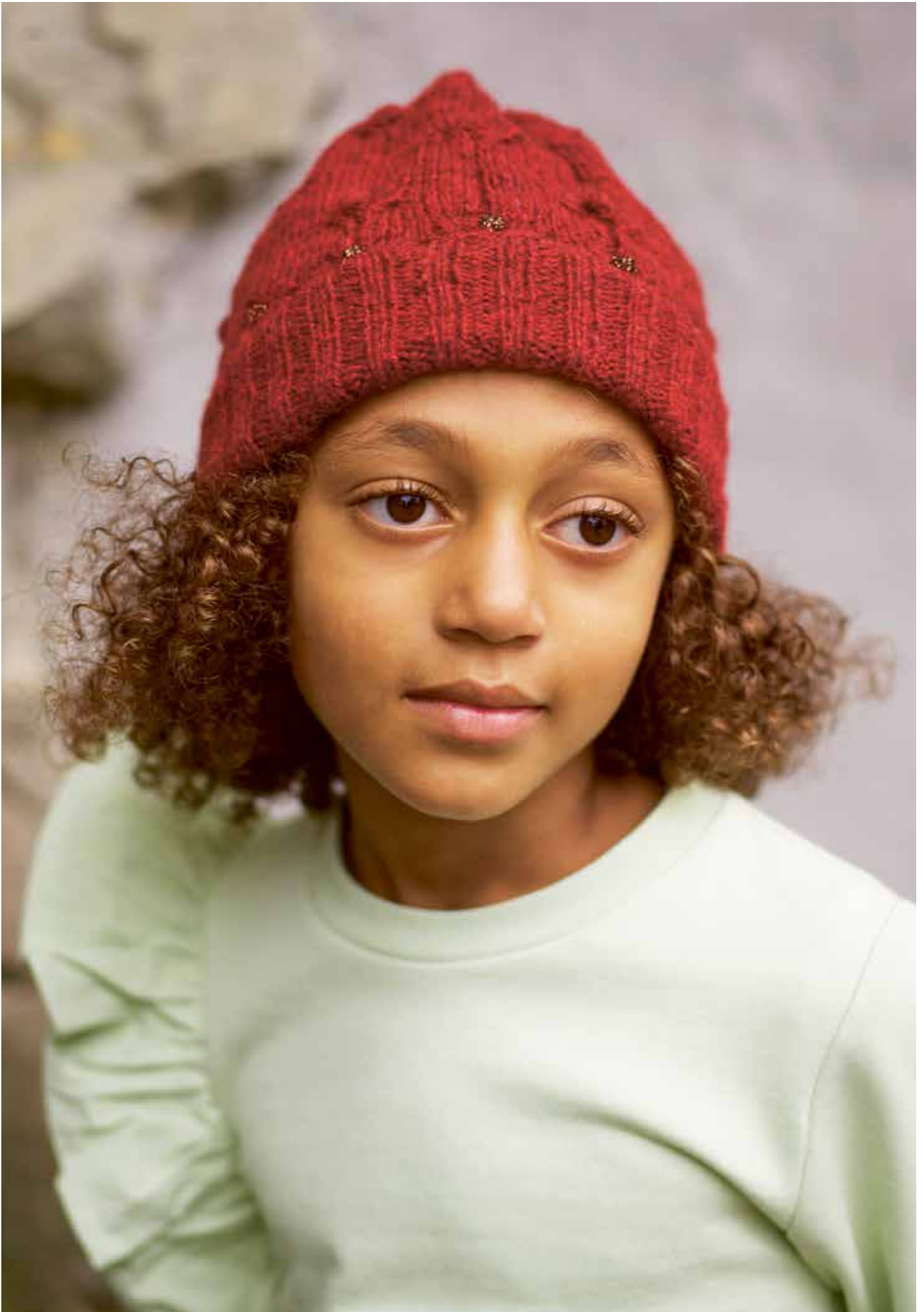
311-14 Trikselue i Finull og Concorde 2 - 12 år