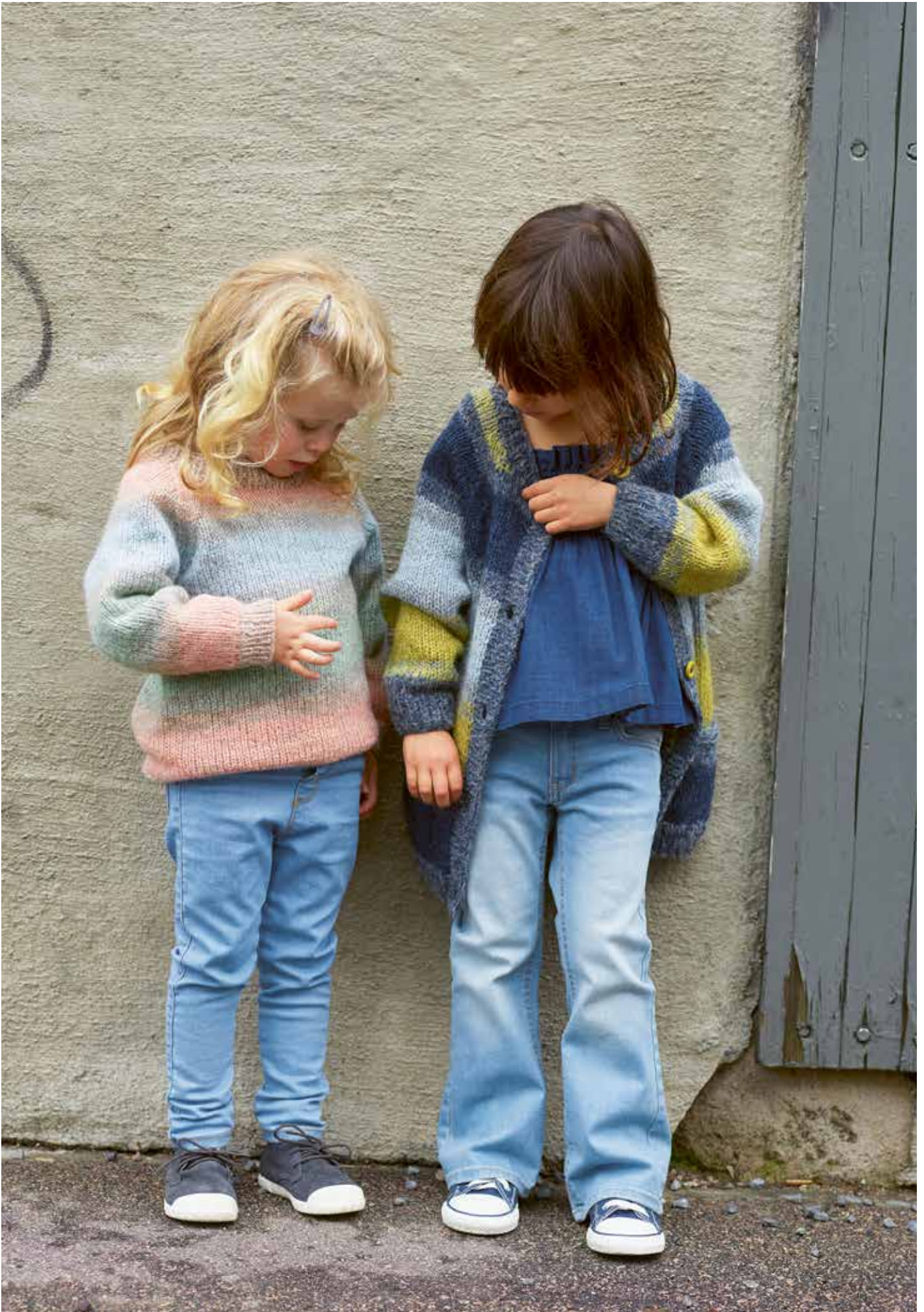
311-3 B Go'genser i Finull og Alpaca Silk 2 - 12 år