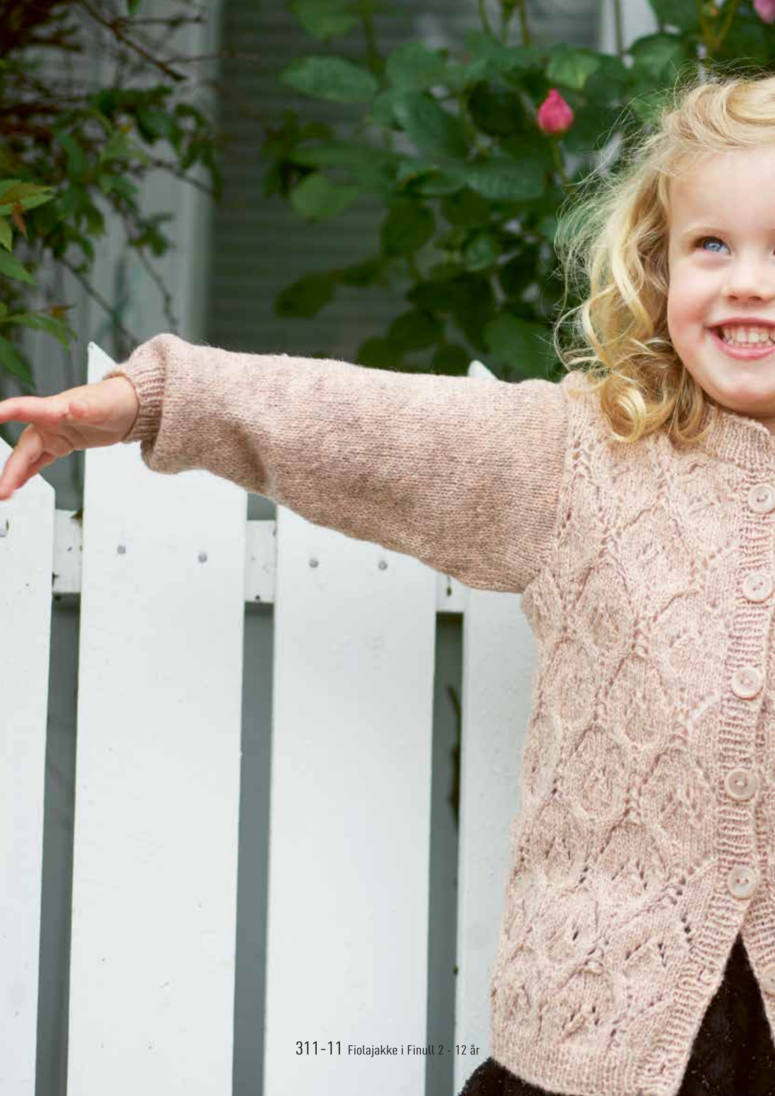
311-11 Fiolajakke i Finull 2 - 12 år